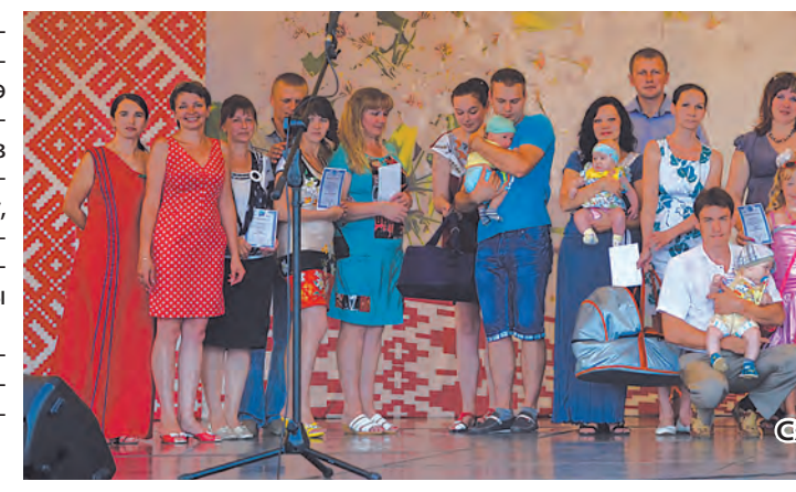
Сямейныя спаборніцтвы ў конкурсе «У гасцях у вішанькі».

Несумненна, самай значнай падзеяй першага фестывалю стала адкрыццё ў горадзе манументальна-дэкаратыўнай скульптуры «Вішанька», якая стала любімым месцам глыбачан і гасцей горада. Скульптар Іван Казак адмыслова стварыў яе ў выглядзе гронкі з трыма вішнямі – як увасабленне сям’і, дзе ёсць тата, мама і дзіця. Апошні дзень фестывалю, 27 ліпеня, быў асабліва багаты на цікавыя мерапрыемствы: конкурс падворкаў, свята кветак, выставы вырабаў народнай майстроў Глыбоччыны, тэматычныя канцэрты і завяршальны фестывальны акорд – аўкцыён «Вішнёвы пірог». Між