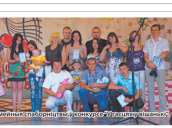
Сямейныя спаборніцтвы ў конкурсе «У гасцях у вішанькі».

Несумненна, самай значнай падзеяй першага фестывалю стала адкрыццё ў горадзе манументальна-дэкаратыўнай скульптуры «Вішанька», якая стала любімым месцам глыбачан і гасцей горада. Скульптар Іван Казак адмыслова стварыў яе ў выглядзе гронкі з трыма вішнямі – як увасабленне сям’і, дзе ёсць тата, мама і дзіця. Апошні дзень фестывалю, 27 ліпеня, быў асабліва багаты на цікавыя мерапрыемствы: конкурс падворкаў, свята кветак, выставы вырабаў народнай майстроў Глыбоччыны, тэматычныя канцэрты і завяршальны фестывальны акорд – аўкцыён «Вішнёвы пірог». Між