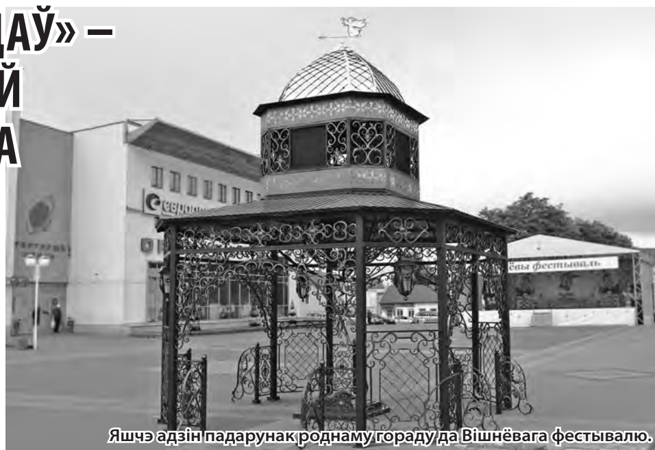
Яшчэ адзін падарунак роднаму гораду да Вішнёвага фестывалю.

Яна ўяўляе сабой вялікую, секцыйную двух’ярусную кованую канструкцыю, якую зрабілі работнікі прыватнага прадпрыемства “У ажур” пад кіраўніцтвам Юрыя Татарыновіча. Цэнтральнае месца экспазіцыі займае зямны шар, вакол якога – жыхары планеты, якіх аб’ядноўваюць агульныя мэты і сяброўства. Гадзіннік паказвае час, за які кожны з нас павінен паспець зрабіць шмат добрага і адметнага для таго, каб наша зямля квітнела і прыгажэла. Гадзіннік светадыёды, вечарам будзе цудоўна глядзецца. З бакоў канструкцыі – беларускі арнамент, упрыгожаны залацістым напыленнем, а на самым версе кан-